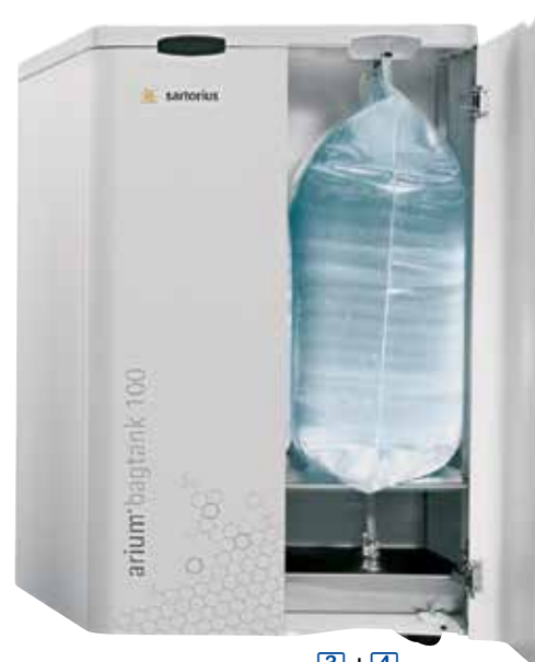
3 + 4