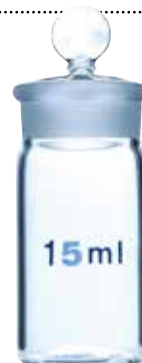
Nacelles de pesée en quartz