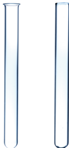
Tubes à essai en quartz