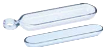
Nacelles de combustion en quartz