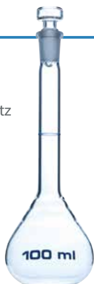
Fioles jaugées en quartz