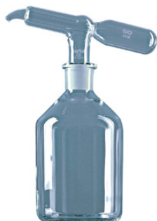
Tête distributrice seule